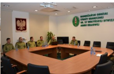
Funkcjonariusze NOSG powrócili z misji w Macedonii