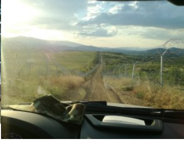
Funkcjonariusze NOSG powrócili z misji w Macedonii