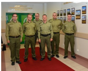
Funkcjonariusze NOSG powrócili z misji w Macedonii

Zgodnie z protokołem w sprawie wspólnej operacji Straży Granicznej z Policją Republiki Macedonii, 30 funkcjonariuszy SG wyposażonych w broń służbową z amunicją, podstawowe środki przymusu bezpośredniego i inny specjalistyczny przenośny sprzęt do ochrony granicy oraz pojazdy służbowe Straży Granicznej udało się do Macedonii na kolejną już misję wsparcia. W ramach misji funkcjonariusze SG wspierali macedońską policję w zadaniach związanych z: rejestracją wniosków o udzielenie ochrony międzynarodowej, badaniem autentyczności dokumentów i zapobieganiem nielegalnemu przekroczeniu granicy poza przejściami granicznymi.