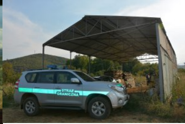
Funkcjonariusze NOSG powrócili z misji w Macedonii