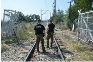
Funkcjonariusze NOSG powrócili z misji w Macedonii