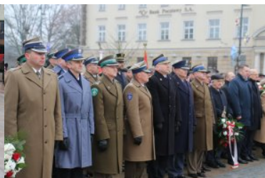
W Lublinie odsłonięto odnowiony Pomnik Nieznanego Żołnierza