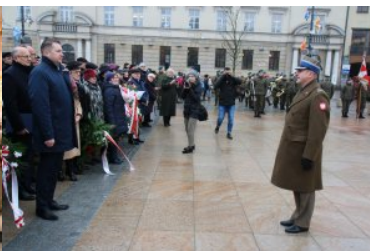
W Lublinie odsłonięto odnowiony Pomnik Nieznanego Żołnierza