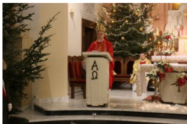
W Lublinie odsłonięto odnowiony Pomnik Nieznanego Żołnierza

W kościele pw. Niepokalanego Poczęcia NMP mszę św. odprawił biskup Mieczysław Cisło. Msza była odprawiona w intencji żołnierzy, którzy oddali życie za Ojczyznę, od początku jej dziejów, w szczególności tych spoczywających bezimiennie. Uroczystości następnie były kontynuowane na Placu Litewskim. Rozpoczęły się od złożenia meldunku dowódcy Garnizonu Lublin, podniesienia flagi państwowej na maszt i odegrania hymnu narodowego. Historię Pomnika Nieznanego Żołnierza przybliżył wszystkim dyrektor lubelskiego oddziału IPN.