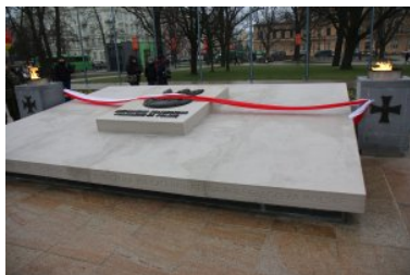
W Lublinie odsłonięto odnowiony Pomnik Nieznanego Żołnierza