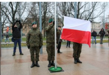
W Lublinie odsłonięto odnowiony Pomnik Nieznanego Żołnierza