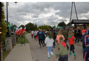
Bieg sztafetowy NOSG „Wokół Niepodległej”