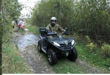
Bieg sztafetowy NOSG „Wokół Niepodległej”