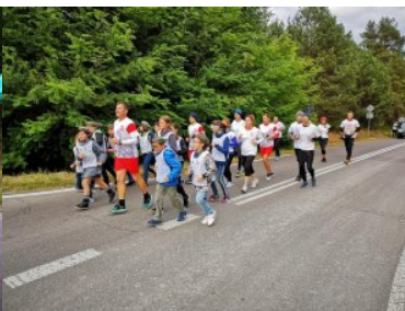
Przekazanie sztafety Siedliska