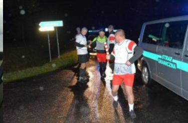
Bieg sztafetowy NOSG „Wokół Niepodległej”