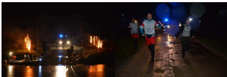
Przekazanie sztafety Gnojno Nemirów

Na terenie Nadbużańskiego Oddziału Straży Granicznej, sztafeta została przejęta od Podlaskiego Oddziału SG, o godz. 22.53 w dniu 23 września br., na odcinku Placówki SG w Janowie Podlaskim w miejscowości Gnojno - Nemirów po przekroczeniu rzeki Bug.