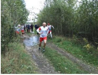
Bieg sztafetowy NOSG „Wokół Niepodległej”