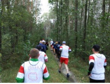
Bieg sztafetowy NOSG „Wokół Niepodległej”