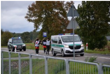
Bieg sztafetowy NOSG „Wokół Niepodległej”