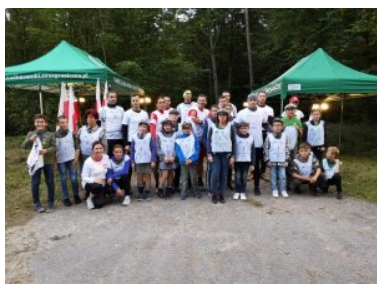
Przekazanie sztafety Siedliska

Od startu, 23 września o godz. 22.53 do momentu przekazania pałeczki Bieszczadzkiemu Oddziałowi SG, uczestnicy II etapu w Nadbużańskim Oddziale SG przebiegli 369 km. W biegu wzięło udział 136 funkcjonariuszy i pracowników cywilnych z naszego oddziału, jak i z innych jednostek organizacyjnych SG. Towarzyszyło im 68 osób z poza Straży Granicznej. Byli to policjanci, strażacy, harcerze, uczniowie oraz przedstawiciele urzędów i instytucji współpracujących z nami. Pałeczkę sztafetową w sumie przekazano 85 razy.