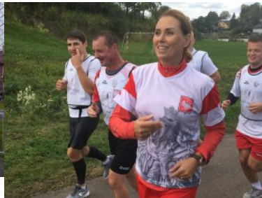
Bieg sztafetowy NOSG „Wokół Niepodległej”