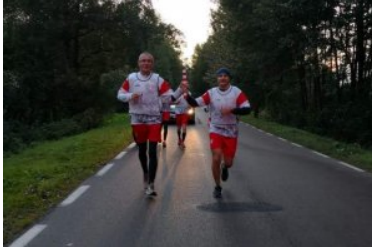
Bieg sztafetowy NOSG „Wokół Niepodległej”