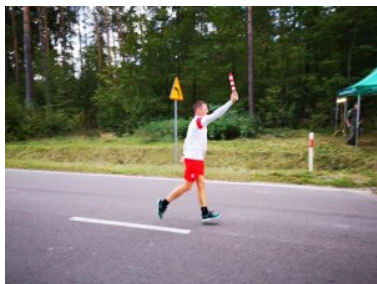
Przekazanie sztafety Siedliska

Bieszczadzkiego Oddziału SG w miejscowości Siedliska.