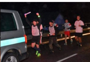
Bieg sztafetowy NOSG „Wokół Niepodległej”