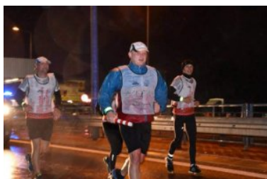
Bieg sztafetowy NOSG „Wokół Niepodległej”

Główne miejscowości przez które przebiegała trasa biegu to: Janów Podlaski, Bohukały, Terespol, Kodeń, Sławatycze, Dołhobrody, Włodawa, Wytyczno, Hańsk, Wola Uhruska, Dorohusk, Skryhiczyn, Horodło, Zosin, Hrubieszów, Kryłów, Dołhobyczów, Chłopiatyn, Korczmin, Dyniska, Machnów, Hrebenne, Siedliska.