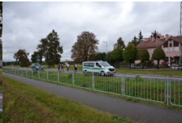
Bieg sztafetowy NOSG „Wokół Niepodległej”