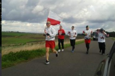
Bieg sztafetowy NOSG „Wokół Niepodległej”