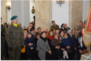
Obchody Narodowego Święta Niepodległości