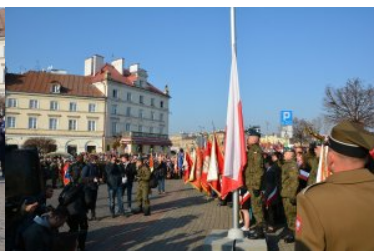
Obchody Narodowego Święta Niepodległości