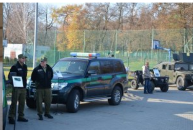
Obchody Narodowego Święta Niepodległości