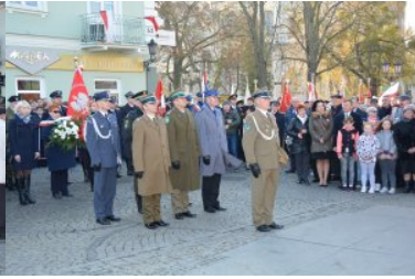
Obchody Narodowego Święta Niepodległości

Funkcjonariusze Nadbużańskiego Oddziału Straży Granicznej, włączyli się również w pikniki patriotyczne służb mundurowych, które zostały zorganizowane w Lublinie oraz w Rejowcu Fabrycznym.