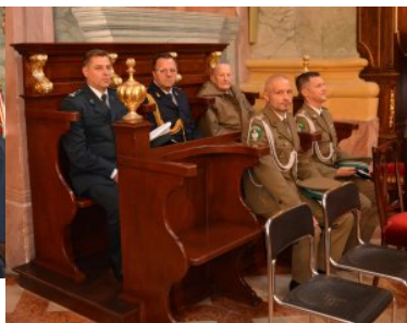
Obchody Narodowego Święta Niepodległości