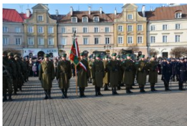
Obchody Narodowego Święta Niepodległości