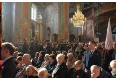
Obchody Narodowego Święta Niepodległości