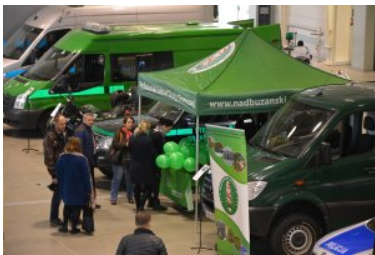
Obchody Narodowego Święta Niepodległości

Funkcjonariusze Nadbużańskiego Oddziału Straży Granicznej, włączyli się również w pikniki patriotyczne służb mundurowych, które zostały zorganizowane w Lublinie oraz w Rejowcu Fabrycznym.