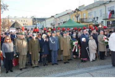
Obchody Narodowego Święta Niepodległości