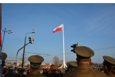
Obchody Narodowego Święta Niepodległości

Kolejnym punktem obchodów był odsłonięcie Masztu Niepodległości na rondzie pod zamkiem noszącym imię Romana Dmowskiego w Lublinie.