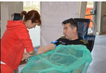
Obchody Narodowego Święta Niepodległości