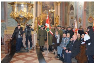
Obchody Narodowego Święta Niepodległości