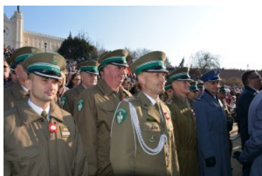
Obchody Narodowego Święta Niepodległości