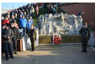
Obchody Narodowego Święta Niepodległości