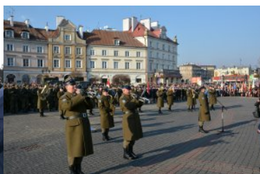
Obchody Narodowego Święta Niepodległości