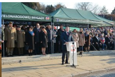
Obchody Narodowego Święta Niepodległości