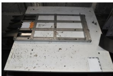
Przemycali i produkowali nielegalne papierosy