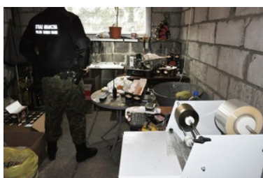
Przemycali i produkowali nielegalne papierosy

28 marca br., funkcjonariusze Straży Granicznej z Placówki we Włodawie, podczas działań związanych z ochroną granicy państwowej zatrzymali tuż po przemyście papierosów, dwóch obywateli Polski. Mężczyźni tuż przed zatrzymaniem, nie reagując na polecenia i sygnały funkcjonariuszy, podjęli próbę ucieczki. Jadąc na próbujących ich zatrzymać funkcjonariuszy SG, stwarzali realne zagrożenie dla ich zdrowia oraz życia. Po oddaniu strzałów ostrzegawczych i krótkim pościgu ich auto marki Audi zostało zatrzymane przez SG. Funkcjonariusze zabezpieczyli też papierosy, które przemytnicy wyrzucali z samochodu podczas jazdy. W toku dalszych czynności, funkcjonariusze SG, na terenie pow. włodawskiego, dokonali przeszukania czterech posesji. Na jednej z nich, mundurowi ujawnili „domową” linię do nielegalnej produkcji papierosów. Na miejscu zabezpieczono również krajankę tytoniową, gilzy papierosowe, puste opakowania oraz „wyprodukowane” już papierosy. Do sprawy został zatrzymany kolejny mężczyzna, był to właściciel jednej z kontrolowanych posesji.