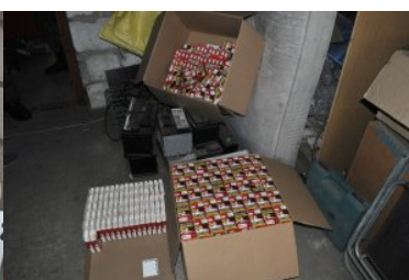
Przemycali i produkowali nielegalne papierosy