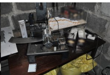
Przemycali i produkowali nielegalne papierosy