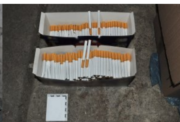
Przemycali i produkowali nielegalne papierosy