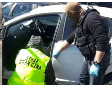
Kradzione części samochodowe