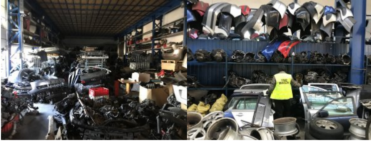
Kradzione części samochodowe