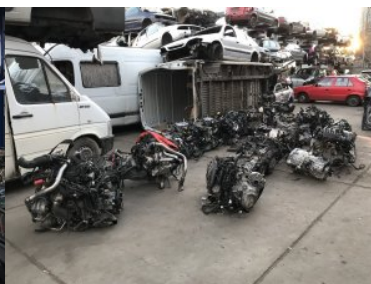
Kradzione części samochodowe