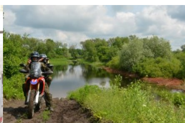
Nadbużański Oddział Straży Granicznej – podsumowano I półrocze 2019

W pierwszym półroczu tego roku, podczas prowadzonych kontroli zarówno w przejściach granicznych jak i w terenie, funkcjonariusze NOSG, wyegzekwowali od 1197 osób