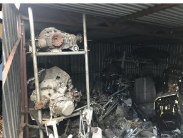
Zabezpieczanie części samochodowych