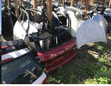
Zabezpieczanie części samochodowych

Ujawnione części to m.in.: silniki, skrzynie biegów, elementy karoserii – drzwi, klapy, elementy zawieszenia, elementy wnętrza pojazdów. Części pochodziły z pojazdów marek: Ford, Volkswagen, Audi, BMW, Jeep, Porsche, Citroen, Skoda.