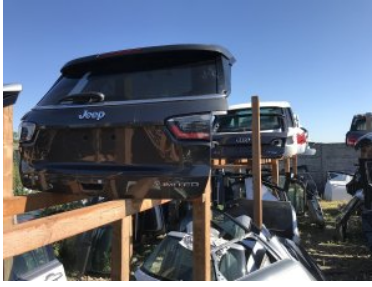
Zabezpieczanie części samochodowych