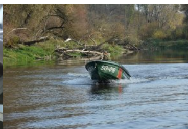
Trwa nabór do służby w Nadbużańskim Oddziale SG

Szczegółowe informacje znajdują się w zakładce: