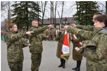
Trwa nabór do służby w Nadbużańskim Oddziale SG