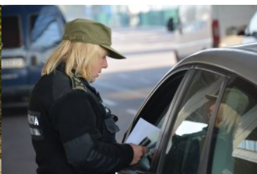
Trwa nabór do służby w Nadbużańskim Oddziale SG