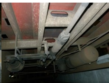
Nielegalne papierosy w tunelu pod wagonem - platformą