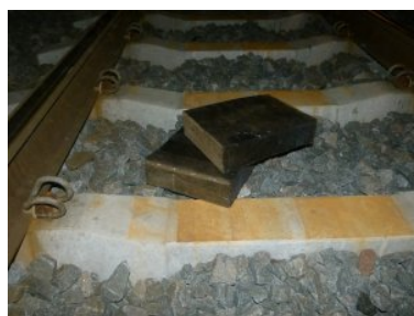
Nielegalne papierosy w tunelu pod wagonem - platformą

To kolejny w ostatnich dniach przypadek przemytu wyrobów akcyzowych udaremniony na granicy w Terespolu. Doświadczenie funkcjonariuszy pozwala znaleźć nielegalny towar, mimo że przemytnicy testują coraz to nowe miejsca i sposoby jego ukrywania.