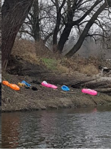
Zatrzymano nielegalnych migrantów