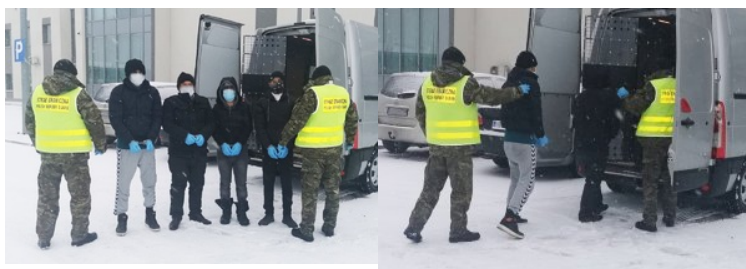
Zatrzymano nielegalnych migrantów

9 grudnia br. podczas działań związanych z ochroną granicy państwowej, funkcjonariusze NOSG z Placówki SG w Kryłowie, dzięki urządzeniom do nocnej obserwacji terenu, zatrzymali w rejonie granicy państwa w powiecie hrubieszowskim, czterech nielegalnych migrantów z Turcji. Mężczyźni przy pomocy dmuchanych kółek do zabawy w wodzie, przepłynęli rzekę graniczną i nielegalnie przekroczyli granicę państwową z Ukrainy do Polski. Po dopłynięciu do polskiego brzegu, przebrali się w suche ubrania i zamierzali jak najszybciej oddalić się w głąb kraju. W tym momencie do akcji wkroczyli funkcjonariusze SG, którzy zatrzymali całą czwórkę. Po przebadaniu ich przez lekarza oraz pobraniu od nich próbek na obecność SARS-CoV-2, nielegalni migranci zostali przewiezieni do pomieszczeń służbowych Straży Granicznej.