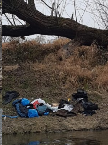
Zatrzymano nielegalnych migrantów

Od początku roku funkcjonariusze z Nadbużańskiego Oddziału SG zatrzymali już ponad 50 osób, które nielegalnie przekroczyły granice państwową. Dla większości z nich miejscem docelowym nielegalnej migracji miała być Europa Zachodnia.