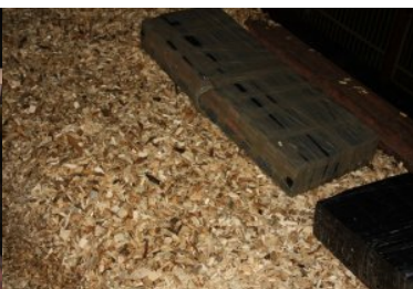
Papierosy ukryte w wagonach typu węglarki

Przemyt papierosów w zrębce drewna jest w ostatnich miesiącach najczęstszą formą przemytu na kolejowym odcinku granicy z Białorusią.