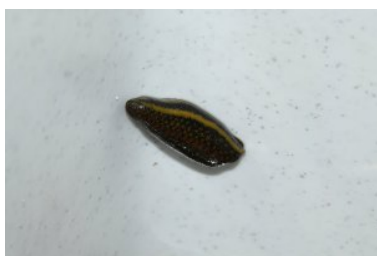
Bagaż z pijawkami

W związku z przemytem przeciwko kierowcy autokaru, 42-letniemu obywatelowi Ukrainy, funkcjonariusze KAS wszczęli postępowanie karne skarbowe, zajmując na poczet kary 4 tys. złotych. Mężczyzna wyjaśnił, iż przesyłka została nadana we Lwowie i miała zostać odebrana w Warszawie Zachodniej przez nieznaną mu osobę. Miały się w niej znajdować robaki na ryby. Ze wstępnych ustaleń wynika, że ujawnione pijawki należą do gatunków objętych ochroną Konwencji Waszyngtońskiej.