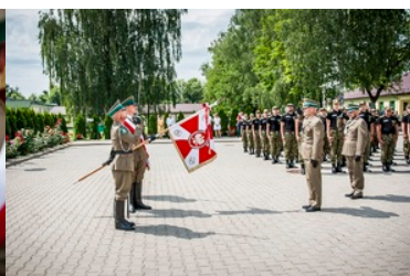
Ślubowanie nowo przyjętych funkcjonariuszy NOSG