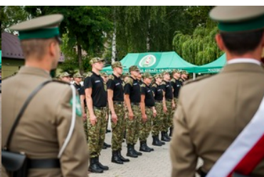
Ślubowanie nowo przyjętych funkcjonariuszy NOSG