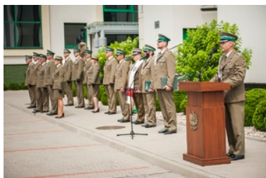
Ślubowanie nowo przyjętych