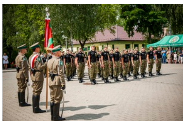
Ślubowanie nowo przyjętych funkcjonariuszy NOSG