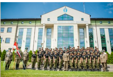
Ślubowanie nowo przyjętych