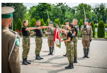
Ślubowanie nowo przyjętych funkcjonariuszy NOSG