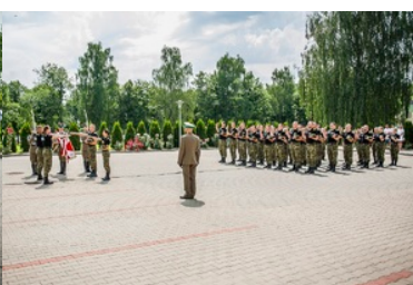
Ślubowanie nowo przyjętych funkcjonariuszy NOSG