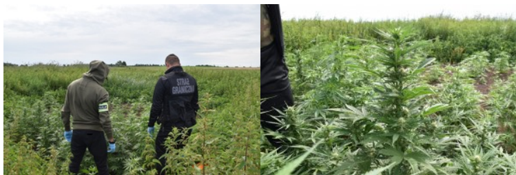
Zlikwidowano nielegalną plantację marihuany

Ustalenia funkcjonariuszy potwierdziły się i na działce rolnej w gminie Ulhówek ujawnili i zabezpieczyli 135 krzaków konopi indyjskich a także przedmioty służące do uprawy roślin oraz fotopułapkę zamontowaną w pobliżu roślin.