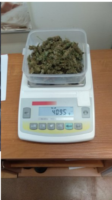
Zlikwidowano nielegalną plantację marihuany

Łącznie zabezpieczono 163 krzaki konopi i ponad 1,5 kilograma suszu roślinnego oraz sprzęt wykorzystywany do uprawy roślin. Wobec 27-latka sąd na wniosek prokuratury zastosował środek zapobiegawczy w postaci tymczasowego aresztowania na okres trzech miesięcy z możliwością zmiany tego środka z chwilą wpłacenia poręczenia majątkowego w kwocie 10 tysięcy złotych.