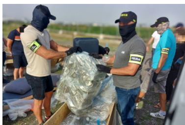
Przejęte 112 kg marihuany, zatrzymane 3 osoby i zlikwidowany magazyn narkotyków

dynamicznych czynności, zatrzymano 2 osoby i przejęto 79 kg marihuany. Była to partia narkotyków, która dotarła do Warszawy z Hiszpanii ukryta w meblach. Kolejną część marihuany, tj.: 33 kg ujawniono w miejscu zamieszkania trzeciego zatrzymanego, także w Warszawie. Jedno z pomieszczeń było wykorzystywane jako magazyn narkotyków. Łącznie podczas akcji funkcjonariusze zabezpieczyli ponad 112 kg marihuany o czarnorynkowej wartości około 5,5 mln zł. Ponadto ujawniono i zabezpieczono majątek należący do podejrzanych wart ok. 200 tys. zł oraz nielegalną amunicję. W trakcie akcji, wsparcia udzielili policjanci z Komendy Powiatowej Policji w Garwolinie.