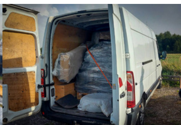
Przejęte 112 kg marihuany, zatrzymane 3 osoby i zlikwidowany magazyn narkotyków