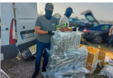
Przejęte 112 kg marihuany, zatrzymane 3 osoby i zlikwidowany magazyn narkotyków