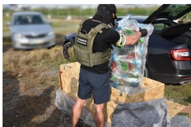
Przejęte 112 kg marihuany, zatrzymane 3 osoby i zlikwidowany magazyn narkotyków