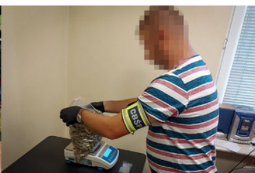
Przejęte 112 kg marihuany, zatrzymane 3 osoby i zlikwidowany magazyn narkotyków