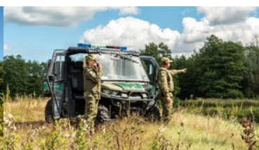
Zostań funkcjonariuszem Straży Granicznej