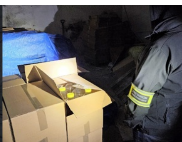
Funkcjonariusze SG zabezpieczają nielegalne papierosy oraz alkohol