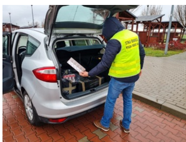
Funkcjonariusze SG zabezpieczają nielegalne papierosy oraz alkohol

Funkcjonariusze z Placówki SG w Sławatyczach, w ramach działań związanych z walką z przestępczością graniczną ustalili, iż z terenów przygranicznych do centrum Polski mogą być przewożone znaczne ilości nielegalnych papierosów. Mundurowi prowadząc już dalsze działania w województwie łódzkim, ustalili i zatrzymali do kontroli samochód osobowy marki FORD. Autem podróżował samotnie 49-letni obywatel Polski, mieszkaniec Białej Podlaskiej. W trakcie prowadzonych czynności potwierdziły się wcześniejsze przypuszczenia funkcjonariuszy co do przewożonego ładunku. W przestrzeni bagażowej tego pojazdu, ujawniono bowiem znaczne ilości papierosów bez polskich znaków akcyzy.