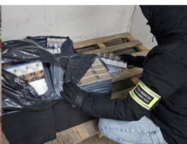
Funkcjonariusze SG zabezpieczają nielegalne papierosy oraz alkohol