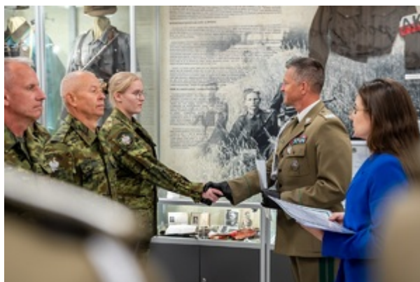
Ślubowanie funkcjonariuszy służby kontraktowej