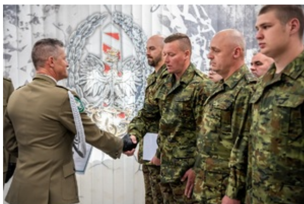
Ślubowanie funkcjonariuszy służby kontraktowej