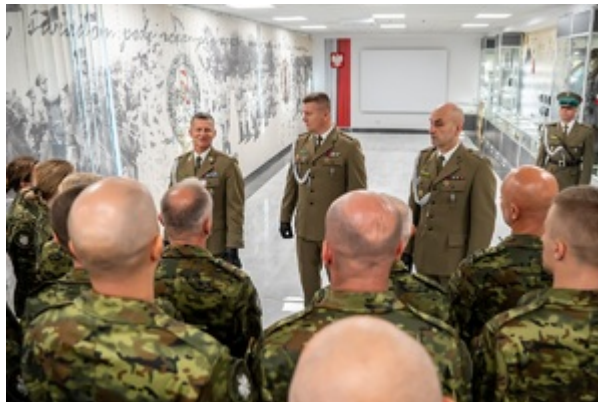
Ślubowanie funkcjonariuszy służby kontraktowej