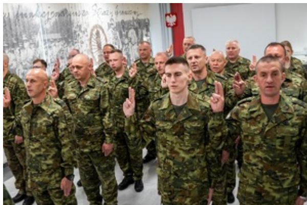
Ślubowanie funkcjonariuszy służby kontraktowej