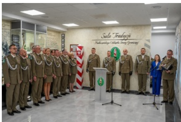
Ślubowanie funkcjonariuszy służby kontraktowej