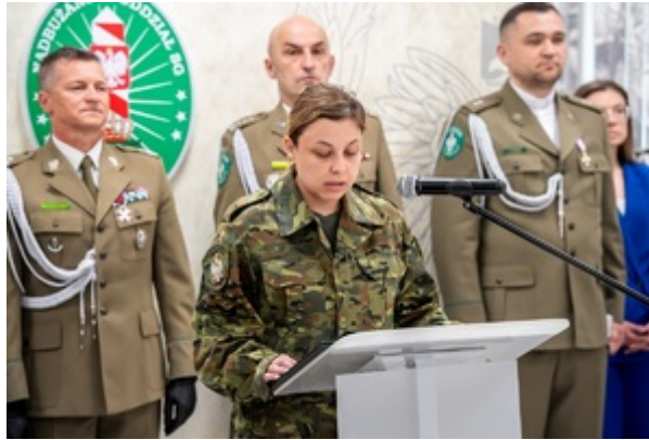
Ślubowanie funkcjonariuszy służby kontraktowej