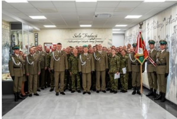
Ślubowanie funkcjonariuszy służby kontraktowej