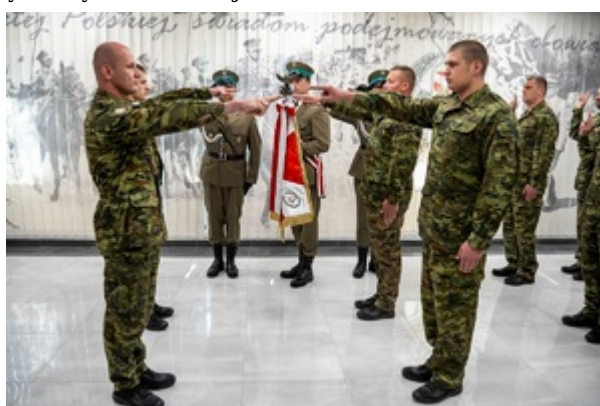
Ślubowanie funkcjonariuszy służby kontraktowej