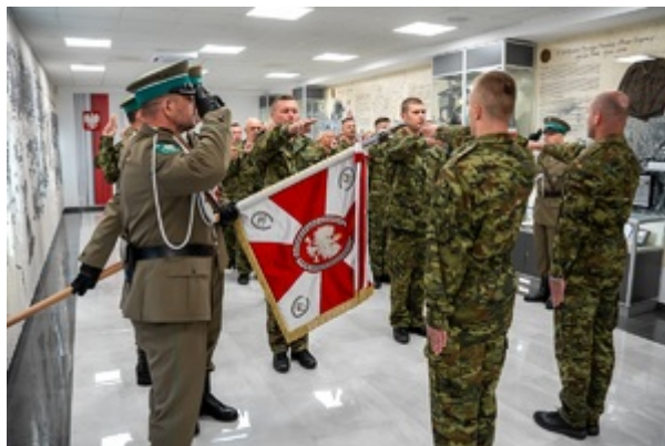
Ślubowanie funkcjonariuszy służby kontraktowej