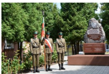
Pomnik "Bohaterom Polskich Służb Granicznych Chroniących Granic Niepodległej Polski" wybudowany w 2012 roku

W dniu 28 września 2012 roku, na terenie Komendy Nadbużańskiego Oddziału Straży Granicznej w Chełmie odbyła się uroczystość odsłonięcia pomnika poświęconego "Bohaterom Polskich Służb Granicznych Chroniących Granic Niepodległej Polski". Pomnik powstał z inicjatywy Straży Granicznej w pracowni rzeźbiarskiej Witolda Marcewicza w Bełżycach. Monument upamiętnia funkcjonariuszy i żołnierzy wszystkich formacji granicznych - przedwojennego Korpusu Ochrony Pogranicza, powojennych Wojsk Ochrony Pogranicza i dzisiejszej Straży Granicznej. Pomnik sfinansowano z dobrowolnych składek przy udziale Rady Ochrony Pamięci Walk i Męczeństwa oraz Związków Zawodowych. Zastąpił on pomnik poświęcony "Chwale Bohaterom WOP 1945-1991".