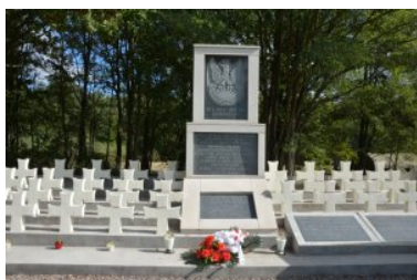
Pomnik "Polska Swoim Obrońcom" w Wytyczno

W początkach formowania się Nadbużańskiego Oddziału SG swój znaczący wkład miało Chełmskie Środowisko Żołnierzy 27 Wołyńskiej Dywizji Piechoty Armii Krajowej. Kombatanci zapraszani są na wszelkie patriotyczne uroczystości organizowane przez Nasz Oddział. Współpraca zaowocowała odbudową cmentarza parafialnego w Zasmykach, uznanego później za cmentarz wojenny 27 WDP AK.