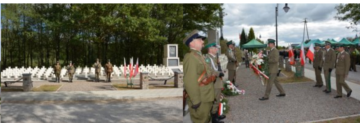
Warta honorowa przy grobach żołnierzy Korpusu Ochrony Pogranicza