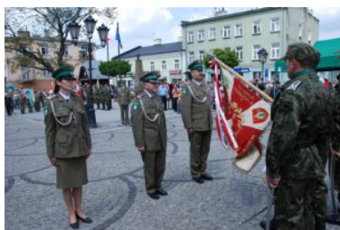
Pożegnanie sztandaru Nadbużańskiego Oddziału Straży Granicznej