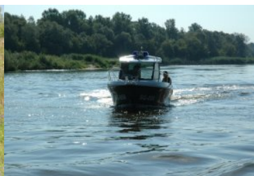
Łódź patrolowa Straży Granicznej na rzece Bug

Nadbużański Oddział Straży Granicznej z chwilą utworzenia realizował zadania siłami 8 strażnic i 4 granicznych placówek kontrolnych, co powodowało, że każda strażnica średnio ochraniała około 60 km granicy. Obecnie w NOSG funkcjonuje 20 Placówek Straży Granicznej (18 pełniących służbę w bezpośredniej ochronie granicy państwa oraz dwie w głębi kraju) i 12 przejść granicznych w tym 7 drogowych, 4 kolejowe i 1 lotnicze. Średnia długość ochranianego odcinka granicy państwowej przez jedną placówkę wynosi około 25 km.