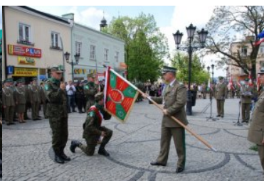
Przywitanie nowego sztandaru Nadbużańskiego Oddziału Straży Granicznej