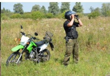
Funkcjonariusz Straży Granicznej obserwuje granicę państwa