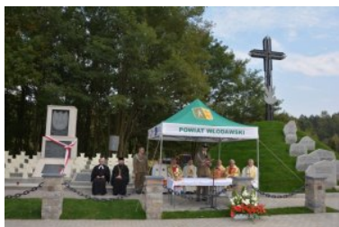
Msza ekumeniczna przy Kopcu Chwały Żołnierzy Korpusu Ochrony Pogranicza w Wytyczno

dalej groby bezimienne. Spoczywają tam Ci, którzy zginęli walcząc o wolność i nienaruszalność granic.