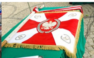
Nowy sztandar Nadbużańskiego Oddziału Straży Granicznej